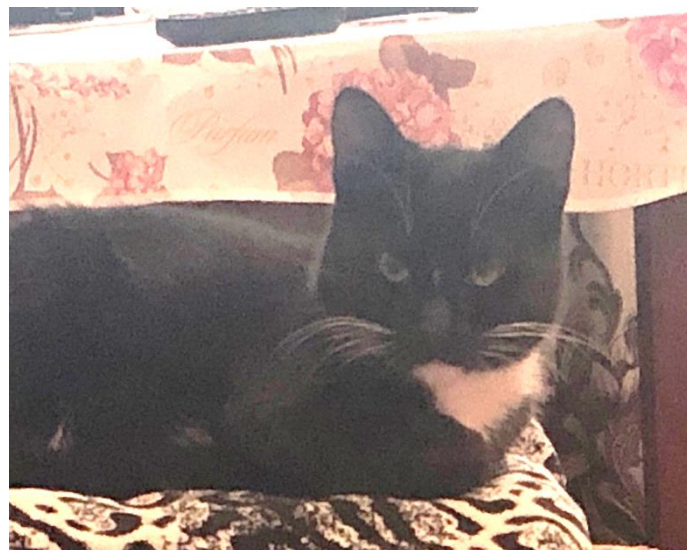
Злой кот по кличке Кот, 1 год. Хозяйка: к-11 Ангелина

В России насчитывается около 700 тысяч бездомных кошечек и собачек. Мы уверены, если у вас ещё нет любимца, то в приюте вы обязательно сможете найти того, кто подойдёт вам.