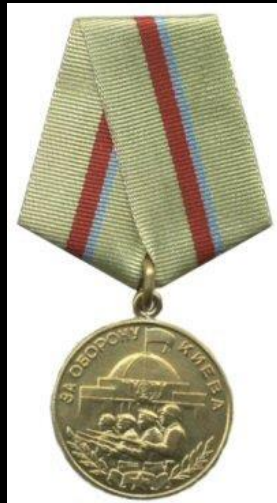
• медаль «За оборону Киева»