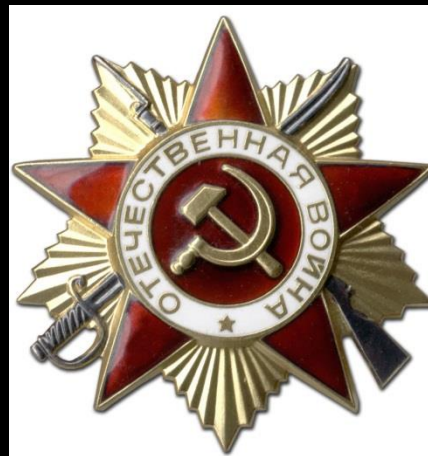
• орден Отечественной войны