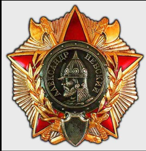
• орден Александра Невского