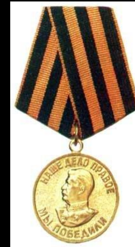
• медаль «За Победу над Германией»